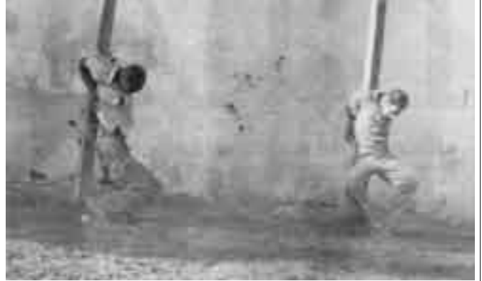
Deux guérilleros capturés et exécutés en 1964.

canadiennes. Indépendamment presque de la valeur intrinsèque du roman, ses thèmes (révolte contre l'oppression sexuelle et politique), le