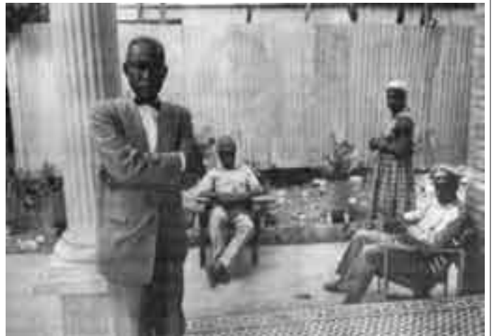
François Duvalier, dit Papa Doc, le 1 er mai 1957.